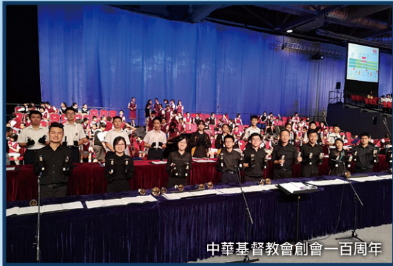
中華基督教會創會一百周年

手鈴隊則主要培育學生的責任心、自信心和團隊精神。每位學生都會負責每首樂曲中的兩個音，需要有責任心，去完成自己負責部分，讓整個團隊奏出美妙的樂章。隊員在演奏時，要與其他隊員彼此配搭，能培育他們的團隊精神。