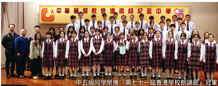
中五級同學榮獲「第七十一屆香港學校朗誦節」冠軍