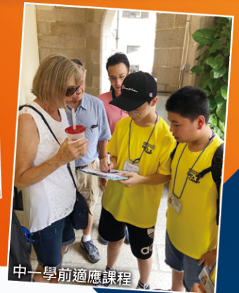
中一學前適應課程